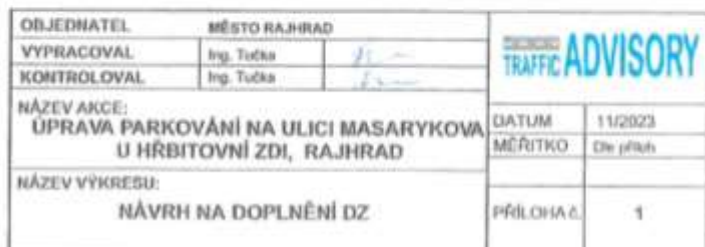
Obrázek 1: Situace dopravního značení